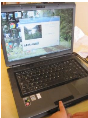
Her laster barna inn bilder som er tatt på turen.