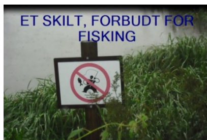
En gutt på 4 år har diktet tekst til sitt eget bilde i bildefortellingen: "Et skilt, forbudt for fisking".