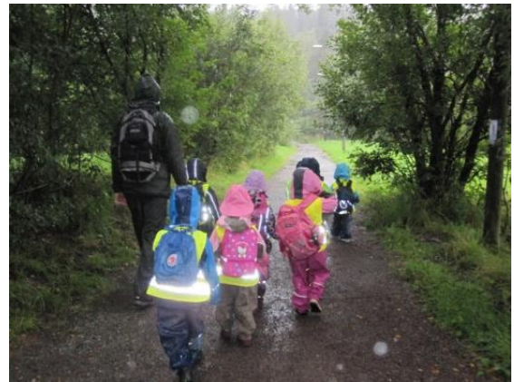
Ut på tur for å utforske nærmiljøet.

Til inspirasjon! En voksen tar med seg en gruppe fireåringer på tur i nærmiljøet. Vanligvis er det mange fugler i og ved vannet de bruker å dra til, men denne dagen var det kun en and å se. Den er langt uti vannet, så barna strever litt med å få bilde av den. Men det ble mye samtale om and! Barna tok andre bilder, en etter en, av det de ville. Dermed ble det samtaler om mange ulike tema, ut fra barnets fokus og det som gruppa oppdaget underveis. Deretter gikk gruppen tilbake til barnehagen hvor barna, sammen som gruppe, lastet bildene fra turen fra kameraet over til datamaskinen, satte bildene sammen og fant ut hvilken tekst de ville ha. En liten lydsnutt ble også lagt til fortellingen.